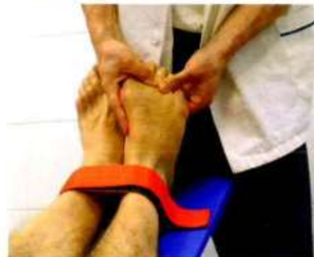
Manovra che permette il corretto riposizionamento delle teste metatarsali svolta in postura di Allungamento Muscolare Globale Decompensato.

ed il suo disagio è già stato ridotto dell'80%; non avverte più dolori, se non una lieve sofferenza quando calza scarpe dalla suola particolarmente sottile.