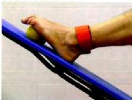
Particolare esercizio che permette di diminuire le tensioni della muscolatura responsabili della caduta delle teste metatarsali

nuto, decide pertanto di proseguire con le sedute Posturali. Nel corso delle sedute successive, oltre a proseguire con il lavoro del primo incontro, sono stati inseriti esercizi posturali per il collo, date le tensioni accumulate durante gli anni di lavoro e di stress.