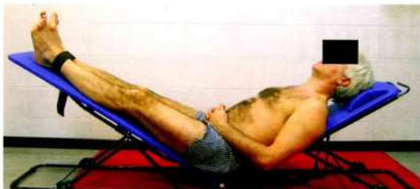
Posizione di lavoro base dell'Allungamento Muscolare Globale Decompensato che permette la messa in tensione delle catene muscolari, le quali coinvolgono anche gli arti inferiori.

L'osservazione della postura del paziente evidenzia la forma dei piedi difforme dai canoni posturali data la forte presenza di dita rattrappite (griffate), con evidentissima caduta delle teste metatarsali. La forma del torace ed il suo modo di respirare esprimono un grosso blocco respiratorio-diaframmatico. A tal proposito il Sig. A, riferisce di vivere da molti anni sottoposto a forti stress per il suo ruolo di responsabile in azienda, rendendosi conto che a volte dimentica di respirare. La colonna presenta curve alterate, ovvero le lordosi cervicale e lombare sono fortemente accentuate. Alla luce di queste evidenze, l'approccio terapeutico e posturologico inizia con esercizi di rilascio e sblocco del muscolo diaframma (il principale della respirazione come già visto negli articoli precedenti) mentre il paziente è in postura decompensata su Pancafit®. Successivamente la seduta Posturologica continua con esercizi che hanno lo scopo di ridurre le tensioni dei muscoli responsabili delle cadute delle teste metatarsali. Alla fine della prima seduta, definita "molto impegnativa", il Sig. A. riferisce che l'appoggio dei piedi a terra risulta decisamente più sicuro ed equilibrato ed è presente una diffusa scioltezza alle ginocchia. Il Paziente, sorpreso del risultato otte-